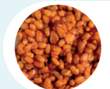
Witte bonen in tomatensaus