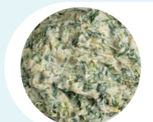
Andijvie a la crème